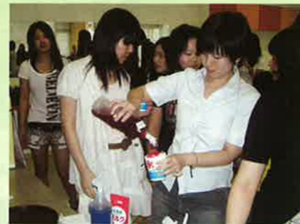
▲いちご味と宇治あずきがとても人気でした。