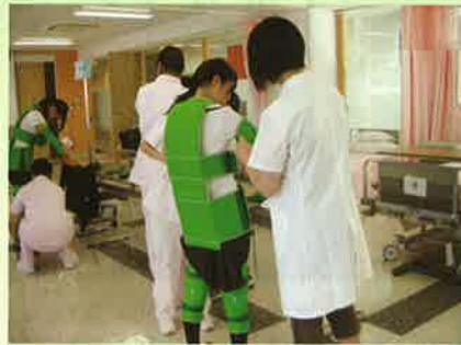
▲看護学科の説明会風景。こちらは老人体験コーナーです。背が曲がったり、視野が狭まったりと、体が言うことをきかなくなります。