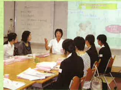
▲助産学科の学校説明会風景です。とっても和やかな雰囲気です。

実際に学校を見て、聞いて、感じる事で更に看護師や助産師について知って頂けると思います。皆さんも一度、学校に遊びにきませんか？