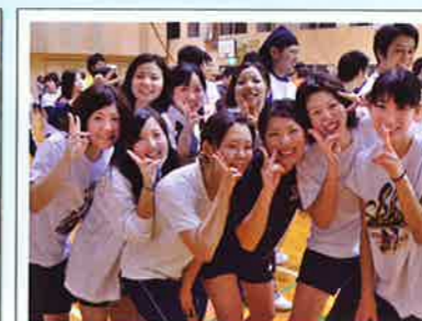
▲試合でのひとコマ

6月18日(土)、毎年恒例の院内バレーボール大会がえぶり小学校体育館で開催されました。どのチームも大会へ向け、休日や仕事の後に猛練習を重ねてきました。激戦の末、第8回大会を制覇したのは「福岡水巻看護助産学校」でした。