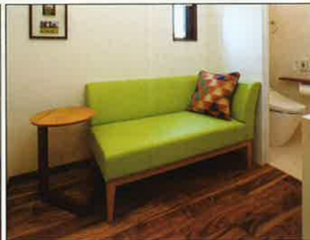
▲大腸カメラ前処置用個室