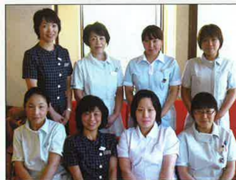
▲スタッフのみなさん