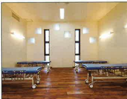
▲内視鏡検査後のリハビリ室