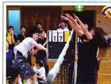
▲スパイクを決める選手